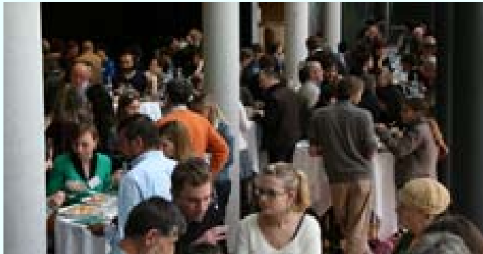
Quasi 200 persone hanno partecipato allo scambio di saperi offerto nel corso del convegno internazionale "Sangue freddo sotto l'effetto serra!".

La città di Bolzano ha concluso il suo anno da Città alpina con l'approvazione da parte del consiglio comunale del Patto per il clima "Bolzano: fonte di Energia. Stima e valutazione delle emissioni di CO2 e programma di misure per la loro riduzione nella città di Bolzano". L'Accademia europea (EURAC) ha sostenuto l'impegno della città, che nei prossimi mesi provvederà a implementare le misure necessarie per