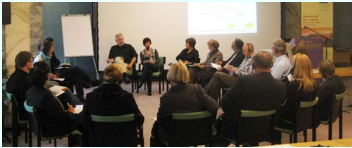
Città e territorio a confronto a Bad Reichenhall/D.

Per l'associazione Città alpina dell'anno il 2009 è stato l'anno del dialogo. Il rapporto fra città e territorio è stato infatti il tema affrontato nel corso del workshop internazionale organizzato in cooperazione e dialogo con la Rete di comuni "Alleanza nelle Alpi" e con il Segretariato permanente della Convenzione delle Alpi e